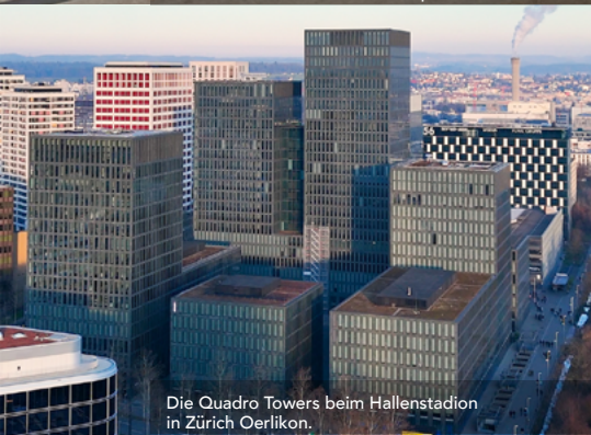
Die Quadro Towers beim Hallenstadion in Zürich Oerlikon.