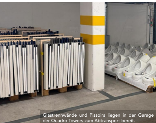
Glastrennwände und Pissoirs liegen in der Garage der Quadro Towers zum Abtransport bereit.